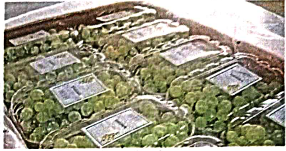
निर्यातीसाठी दर्जेदार, गुणवत्तापूर्ण उत्पादनासोबतच काढणीपरचात प्रक्रियांवर विशेषतः पॅकिंग व ब्रॅण्डिंगवर प्राधान्याने लक्ष द्यावे लागते.